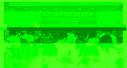
图1 暑期学校学员在讨论环节踊跃发言

暑期学校由北京大学研究生院主办，教育学院承办。本期暑校专业课程主要涵盖教育技术理论研讨、信息技术与课程整合、高等教育信息化、企业数字化学习和新技术支持下的教与学等几个板块。本次暑期学校正式录取学员110名，分别来自全国各地64所各级各类高校、企事业单位，主要是研究生和青年教师（约占30%左右），也包括少量高年级本科生和企业人员。在为期两周的课程中，暑校先后邀请了四位校外学者及6名海外学者。